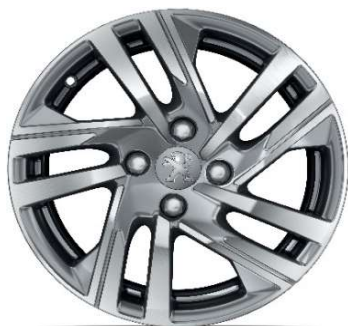
TAKSIM 16" Active Pack