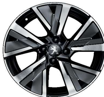
CAMDEN 17" GT