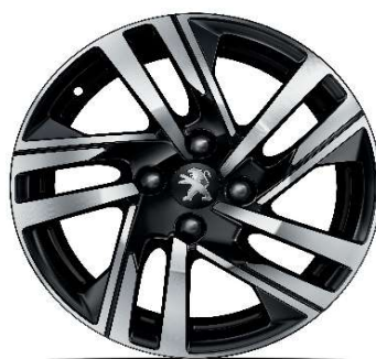
SOHO 16" Allure Pack